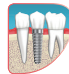
Patienten mit Implantaten