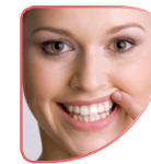
Personen über 35

– welche Patientengruppen sind oft betroffen?