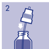
2 Pumpvorrichtung in die Flasche einführen.