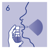
6 Sprührohr in den Mund einführen, Sprühkopf zum Sprühen herunterdrücken.

Sprühkopf und Adapter sind nicht zur Wiederverwendung bestimmt. Nach Aufbrauchen des Flascheninhaltes bitte entsorgen.