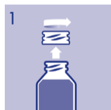
1 Schraubkappenverschluss aufschrauben, Flasche öffnen.

Nach Aufschrauben des Schraubkappenverschlusses wird die Pumpvorrichtung auf die Flasche aufgesetzt und fest verschraubt. Der Adapter wird auf die Pumpvorrichtung aufgesetzt und aufgedrückt, dabei nicht verkanten. Bei Gebrauch die Flasche senkrecht halten. Vor der ersten Anwendung einige Male die Pumpe betätigen, um Luft aus der Pumpvorrichtung zu entfernen. Zur Anwendung wird das Sprührohr in den Mund an die zu behandelnden Stellen eingeführt und der Sprühkopf heruntergedrückt.