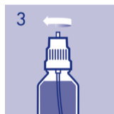
3 Flasche wieder fest verschließen.