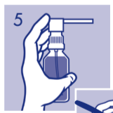
5 Bei Gebrauch Flasche stets aufrecht halten.